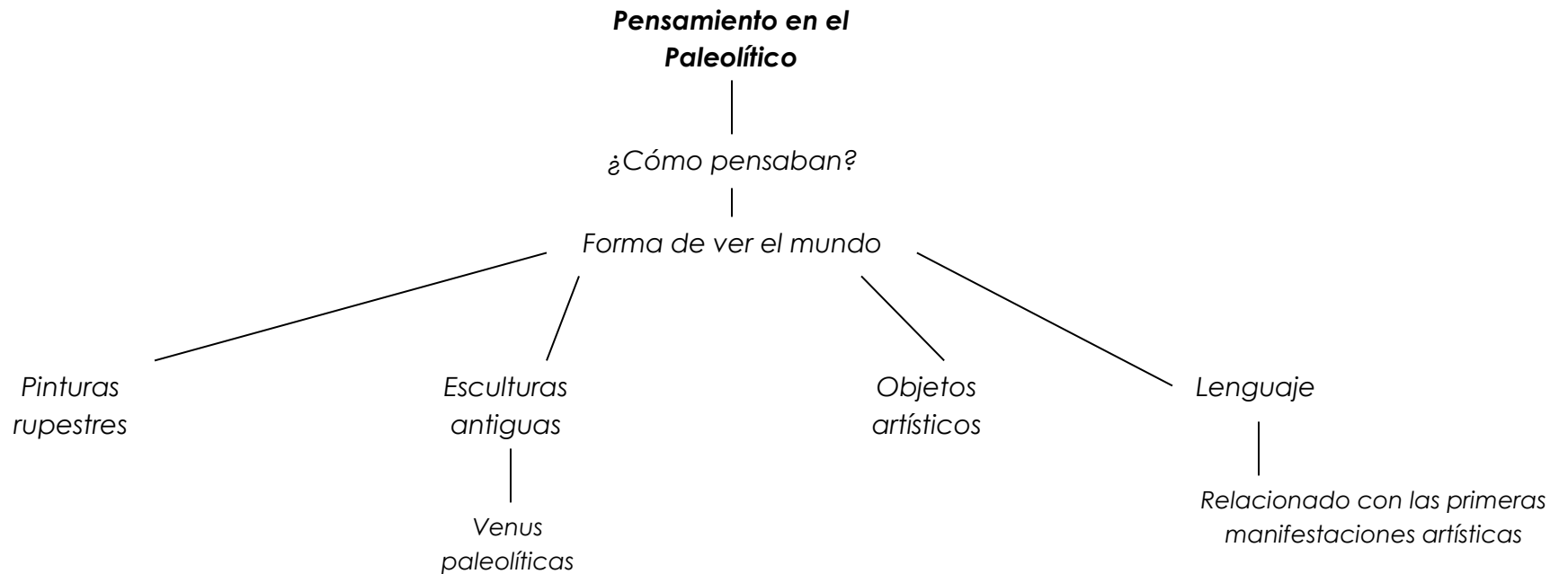
Diagrama de árbol